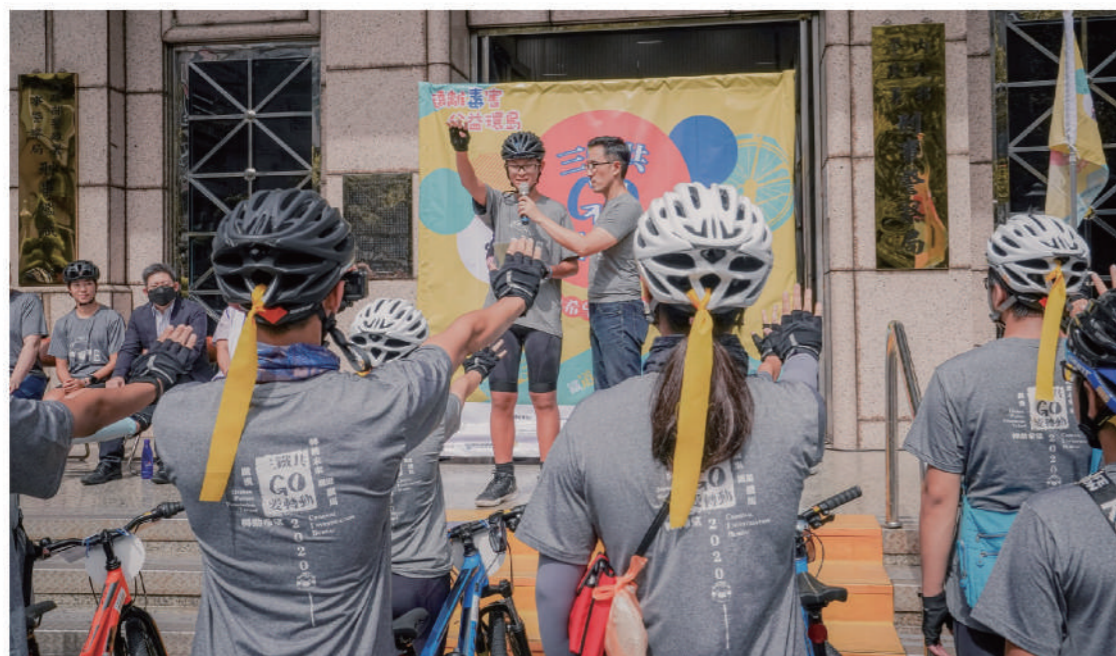
文／高詠恩 攝／曾彥鈞

由失親兒福利基金會與刑事警察局共同主辦的「三鐵共GO愛轉動」。活動行程從8/11-8/21完成接力環島，三鐵分別為鐵道、鐵馬、鐵漢，在執行環島的同時，接受地區挑戰任務，有反毒宣導、海岸淨灘、環境保育、參訪企業等，讓孩子在旅行時學習回饋社會的精神。